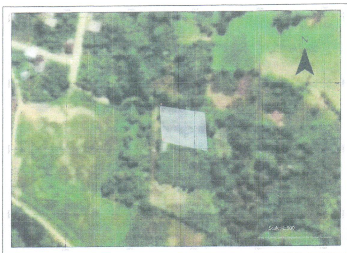
Ilustración 1. Imagen satelital del área destinada para DME